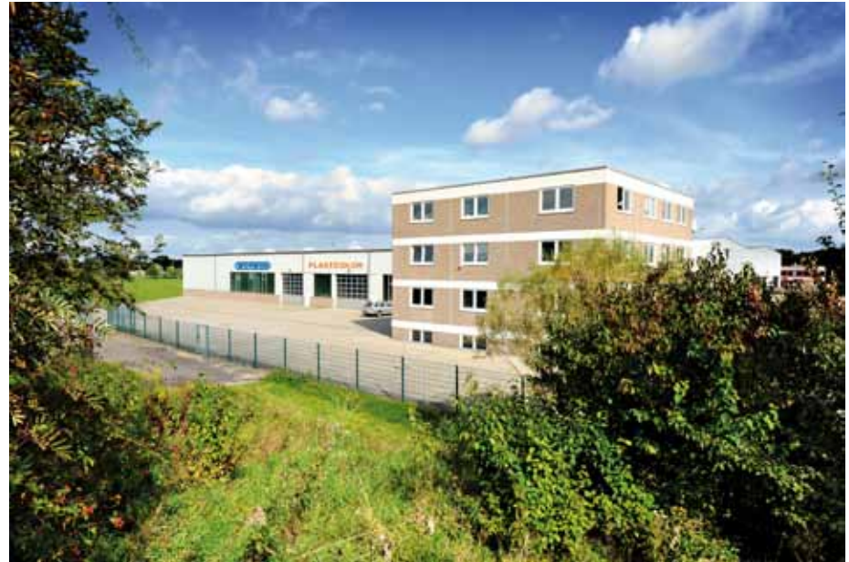
Woywod Produktionsstandort Seefeld